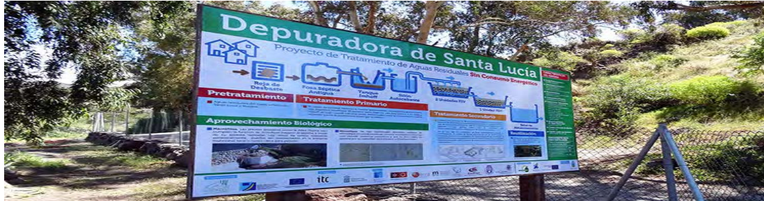
Cartel informativo del Sistema de Depuración Natural construido en Santa Lucía, Gran Canaria.

Temisas (humedal horizontal en serie con una depuradora convencional) y Lomo Fregenal (humedales horizontales en paralelo), desarrollados y gestionados en colaboración con las Mancomunidades de municipios del Sureste y Medianías del Norte de Gran Canaria. En este contexto también se realizó el seguimiento de otros proyectos desarrollados por el Cabildo Insular de Tenerife como el del Albergue de Bólico y el del caserío de Los Carrizales, de los que luego nos ocuparemos.