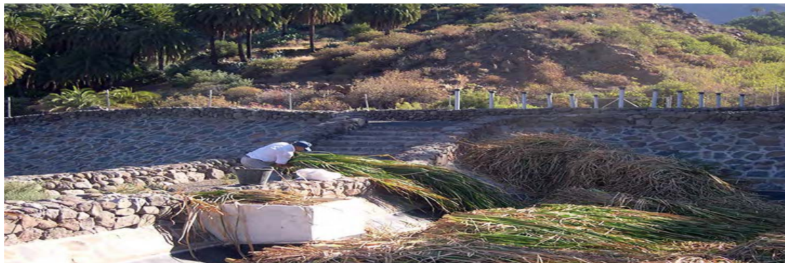
Aprovechamiento de la biomasa generada en el humedal del SDN Santa Lucía después de su poda por un artesano que utiliza las fibras vegetales como material para cestería

A partir de aquí y en el marco del I Programa europeo de cooperación transnacional PCT-MAC se inicia un proceso de transferencia de conocimiento, especialmente hacia Cabo Verde, que incluyó al menos cinco desarrollos de SDN en otros tantos núcleos rurales y urbanos de aquel archipiélago hermano (uno de ellos – es interesante destacarlo– diseñado para atender las necesidades de hasta 2.000 habitantes equivalentes).